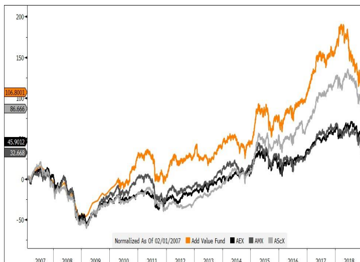
Bron: Bloomberg, op basis van beurskoersen en peildatum 31/12/2018 (koers AVF gebaseerd op slotkoersen onderliggende waarden 30/12/2018)

* Tot € 100 mln fondsvermogen, daarna 0,25% lager voor elke € 50 mln stijging met een minimum van 1% op jaarbasis